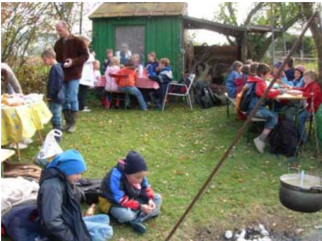
Ein großer Erfolg..

Ostseefähre nach Ronne und Gudhjem/Bornholm. Wir wohnen in einem Ferienpark (s.o.) mit Sauna und starten von dort aus zu den täglichen Inseln. Bornholm gilt als schönste Wanderinsel Europas. Wir sind einziger Anbieter in der Region mit dieser qualifizierten Maßnahme! Info: 06032-804572. Organisationstreffen: Gasthaus zur Krone, Remise, Do. 23.03. um 19:30 Uhr.